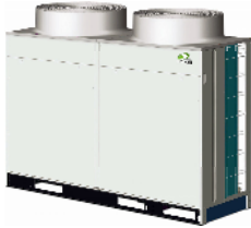
RAS-18 FSN1 RAS-20 FSN1 RAS-24 FSN1 RAS-28 FSN1 RAS-32 FSN1