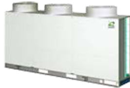
RAS-36 FSN RAS-42 FSN