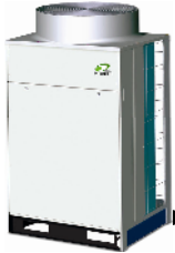
RAS-8.0 FSN1(E) RAS-10.0 FSN1(E) RAS-12.0 FSN1(E)