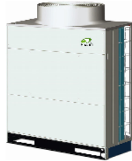
RAS-14.0 FSN1 RAS-16.0 FSN1