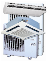
RAS-3.0 FSVNE RAS-4.0 FSVNE RAS-5.0 FSVNE